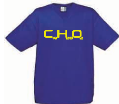
Testo-Shirt 18.00 Euro